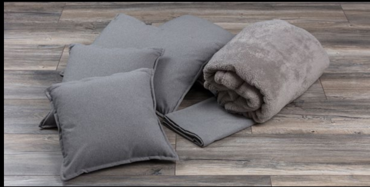
DAS DEKO-PAKET BEINHÄLTET VIER KISSEN, ZWEI KUSCHELDECKEN UND EINE TISCHDECKE IN DER VARIANTE STONE. THE "DECO" PACKAGE CONTAINS FOUR CUSHIONS, A SOFT AND CUDDLY BLANKET AND A TABLE CLOTH IN THE STONE VARIANT.