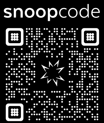
MIT DER T@B EXPERIENCE KANNST DU DIE KNUTSCHKUGEL INTERAKTIV ERKUNDEN, KONFIGURIEREN UND INFORMATIONEN DAZU EINHOLEN – ZU JEDER ERDENKLICHEN ZEIT. PROBIER' ES AUS, ES IST GANZ EINFACH! WITH THE T@B EXPERIENCE, YOU CAN INTERACTIVELY EXPLORE, CONFIGURE, AND OBTAIN INFORMATION ABOUT THE BUBBLE CARAVAN – AT ANY TIME IMAGINABLE. TRY IT OUT, IT'S REALLY EASY!