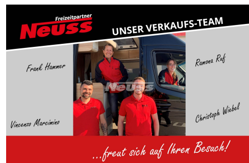
...freut sich auf Ihren Besuch!