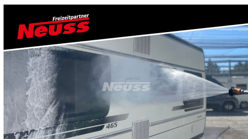
Fahrzeug momentan in Aufbereitung.