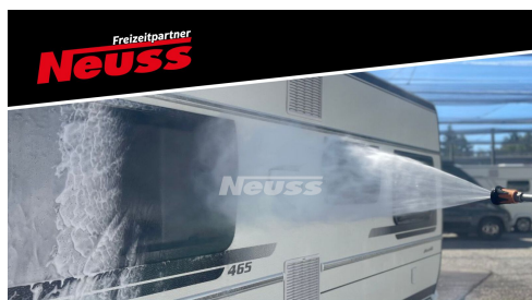
Fahrzeug momentan in Aufbereitung.